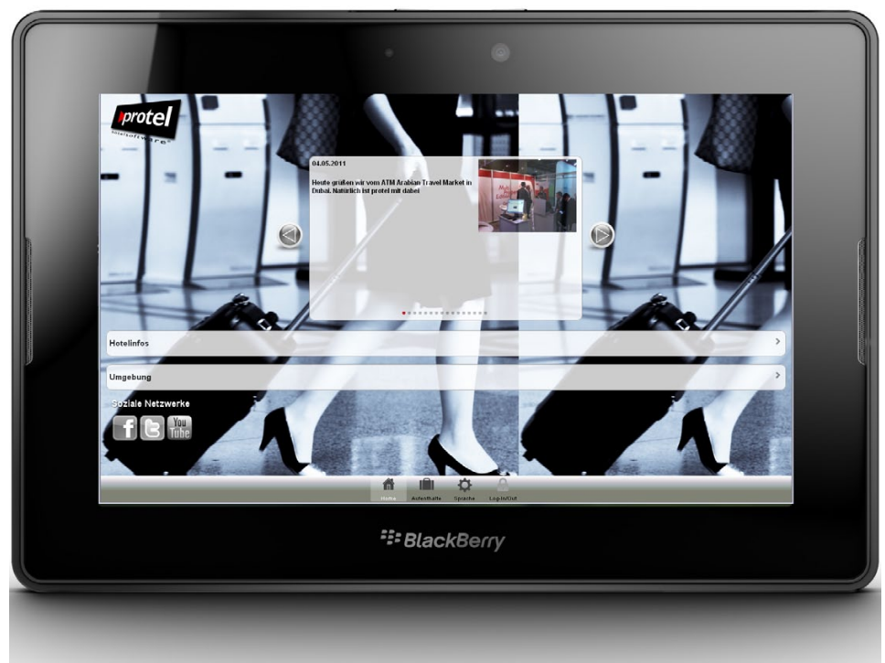
Der Demo-Startbildschirm von protel Voyager im protel-CD auf einem BlackBerry Playbook

Mobilität und Erreichbarkeit – das sind zwei Konzepte, die sich schon länger nicht mehr gegenseitig ausschließen. Ganz im Gegenteil: Handlungsfähig zu sein, während man unterwegs ist, ist eine selbstverständliche Grundvoraussetzung des modernen Geschäftslebens, die längst auch das Privatleben erobert hat.