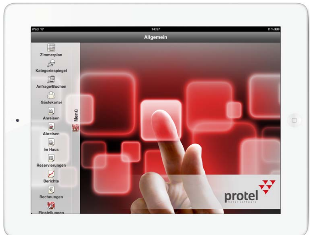
protel for iPad. Startbildschirm mit dem allgemeinen Menü: Alle Funktionen im Überblick

Die klare übersichtliche Oberfläche macht das Arbeiten mit protel auf dem iPad zur Freude und auch für ungeübte Benutzer zur einfachen Fingerübung.